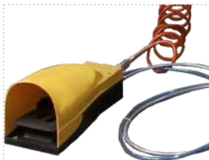
COMANDO CON PEDALIERA